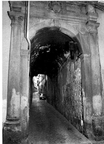
40 IL COMUNE DI VITERBO

Per la tipologia di abitazione, lo stato manutentivo e conservativo risulta buono.